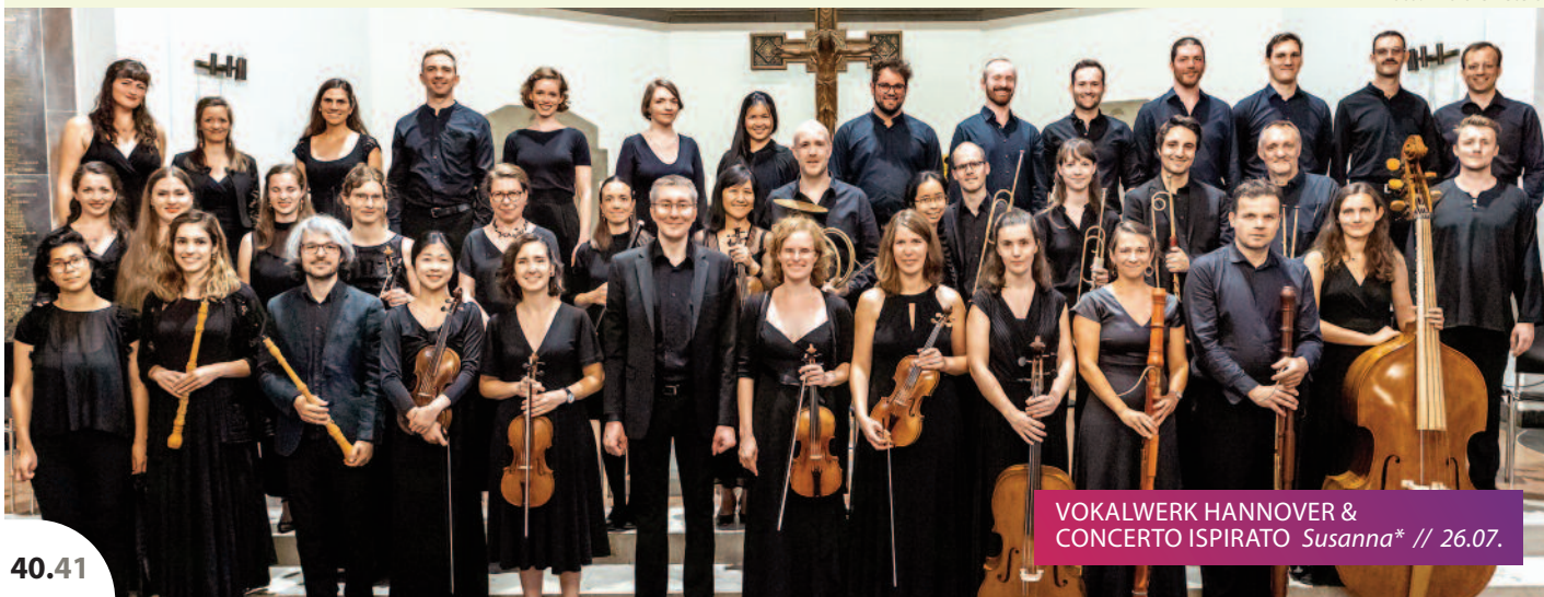
VOKALWERK HANNOVER & CONCERTO ISPIRATO Susanna* // 26.07.