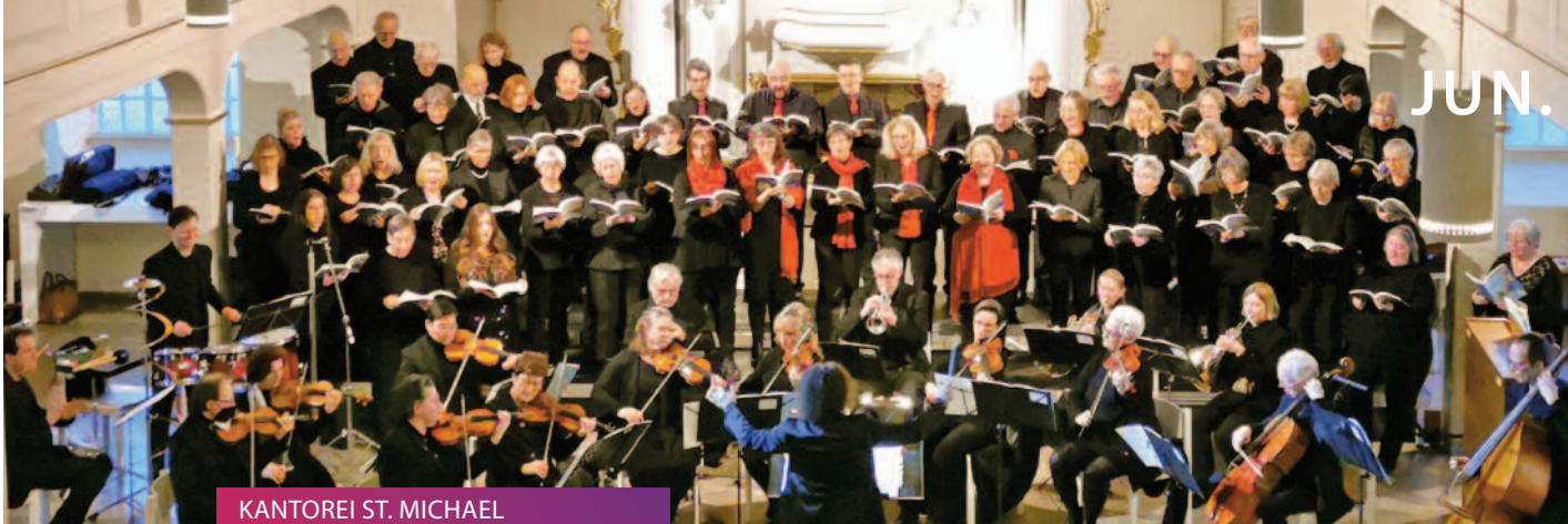
KANTOREI ST. MICHAEL Luigi Gatti: Schöpfungsmesse // 02.06.