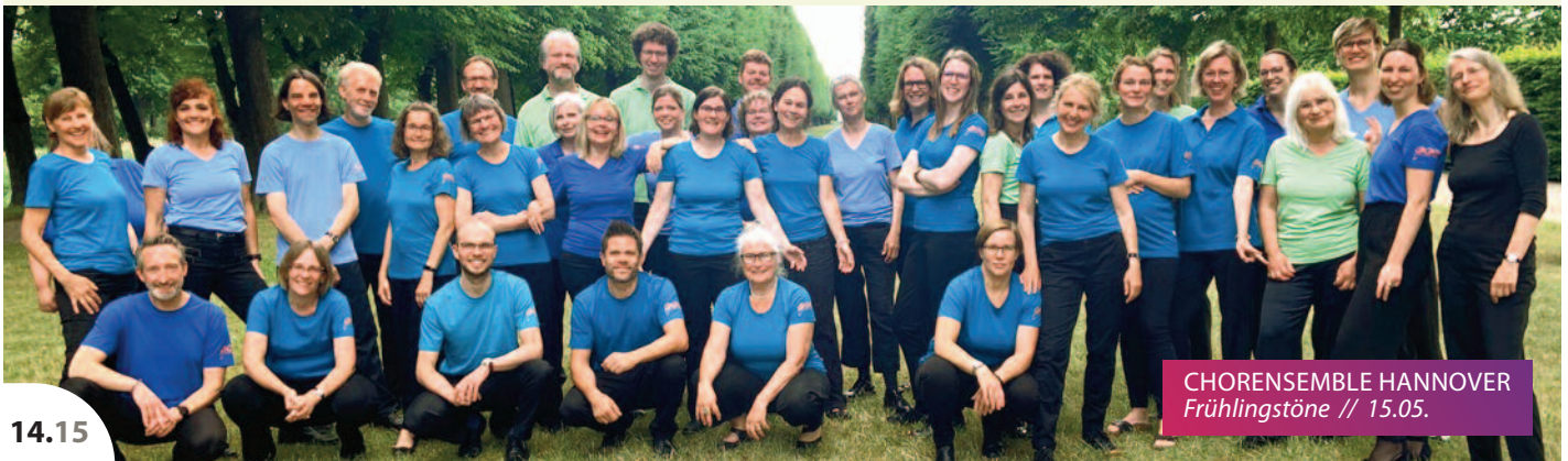
CHORENSEMBLE HANNOVER Frühlingstöne // 15.05.