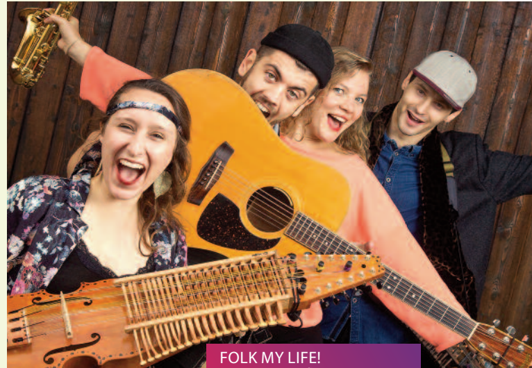
FOLK MY LIFE! Kerniger Dorfbums // 12.05.