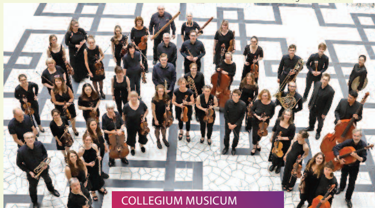
COLLEGIUM MUSICUM Bruckner: Sinfonie Nr. 7 // 30.06.