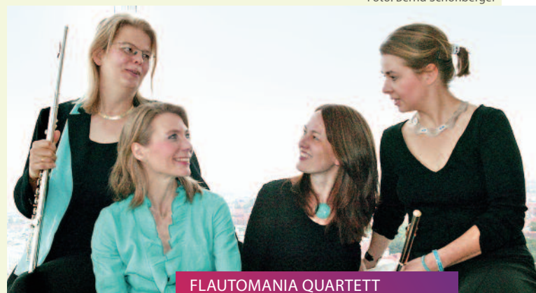
FLAUTOMANIA QUARTETT Soirée: L'après-midi des flûtes // 09.06.