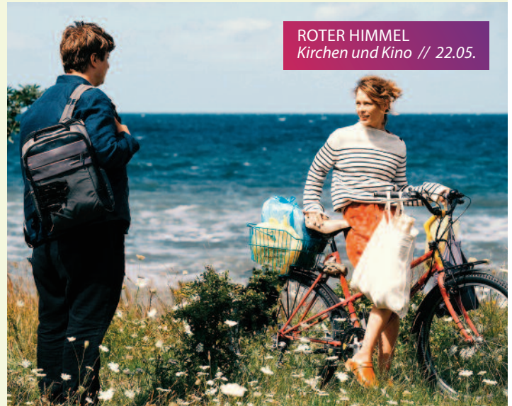
ROTER HIMMEL Kirchen und Kino // 22.05.