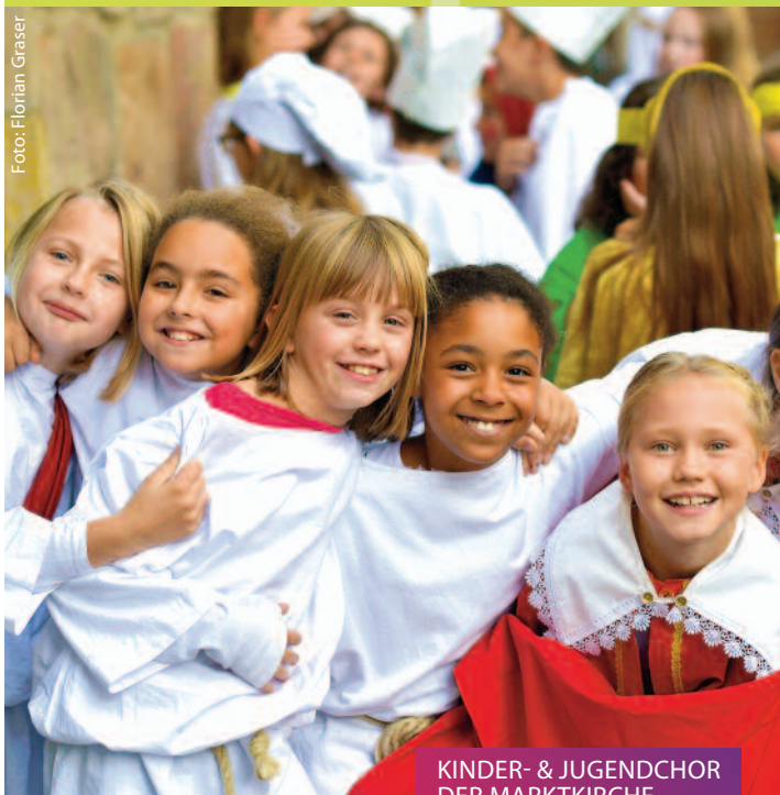
KINDER- & JUGENDCHOR DER MARKTKIRCHE König David // 01.06.