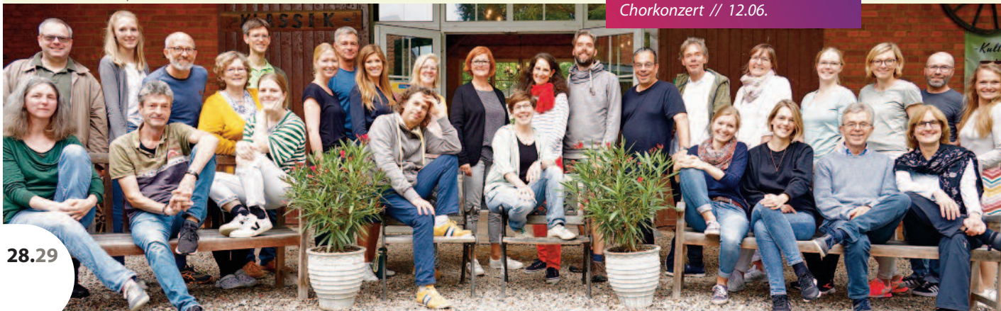
VOCALENSEMBLE KLANGREICH Chorkonzert // 12.06.