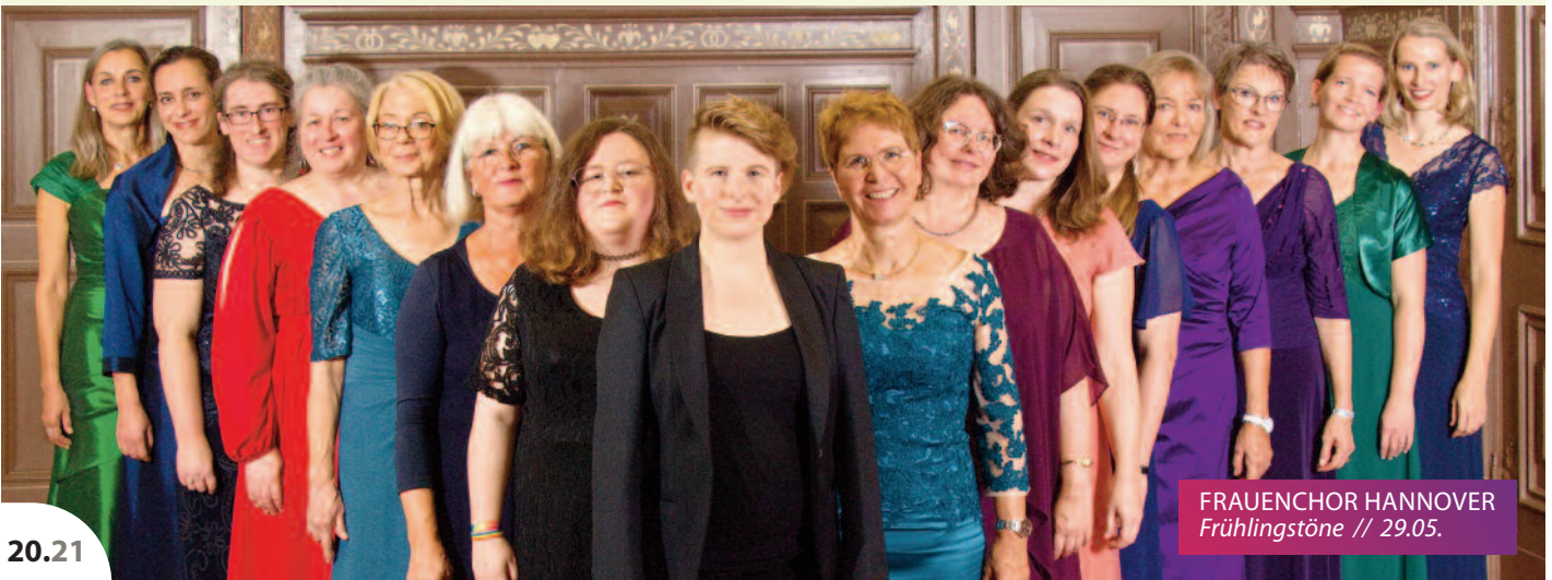
FRAUENCHOR HANNOVER Frühlingstöne // 29.05.