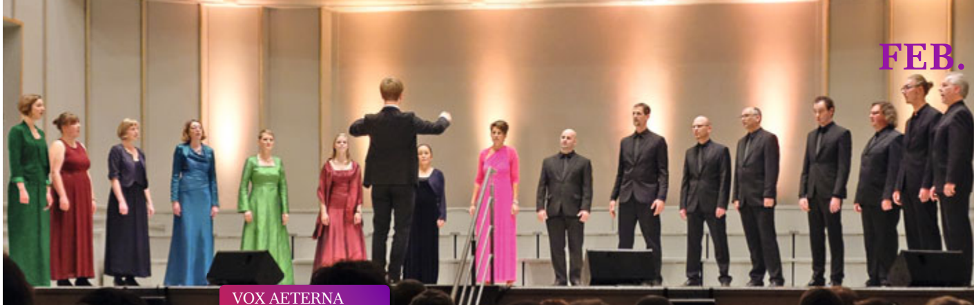
VOX AETERNA Eisblumen // 12.02.