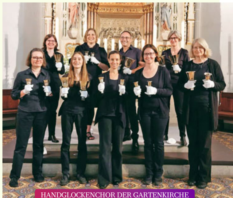
HANDGLOCKENCHOR DER GARTENKIRCHE Evangelische Messe im Kerzenschnitt // 02.02.