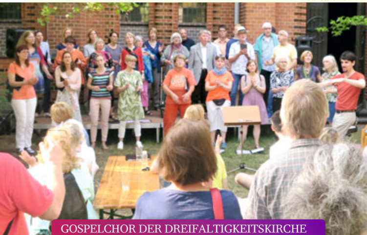
GOSPELCHOR DER DREIFALTIGKEITSKIRCHE Musikalischer Gottesdienst am Karfreitag // 07.04.