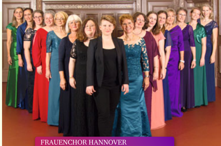
FRAUENCHOR HANNOVER Musikalischer Abendgottesdienst // 16.04.