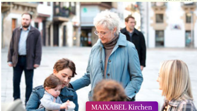
MAIXABEL Kirchen und Kino // 19.04.