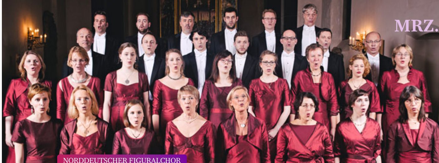
NORDDEUTSCHER FIGURALCHOR J.S. Bach: Matthäus-Passion // 04.03.