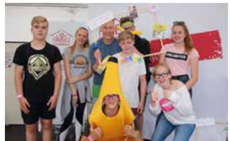
Damals auf dem Kirchentag in Dortmund (2019)