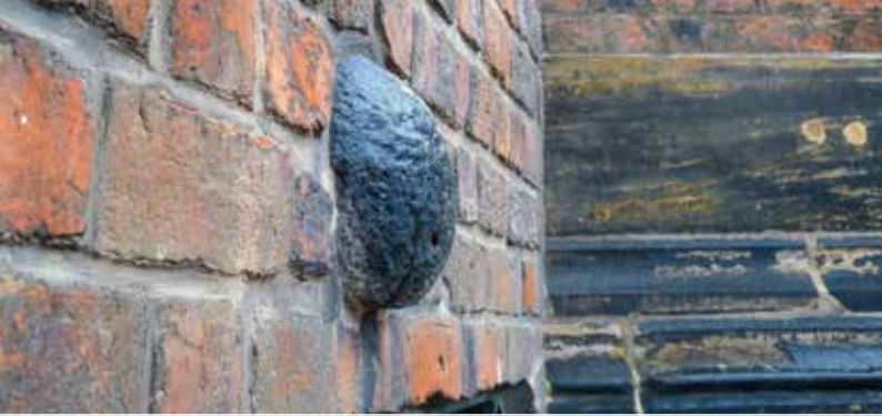
Mahnmal einer dreitägigen Belagerung im Jahre 1486