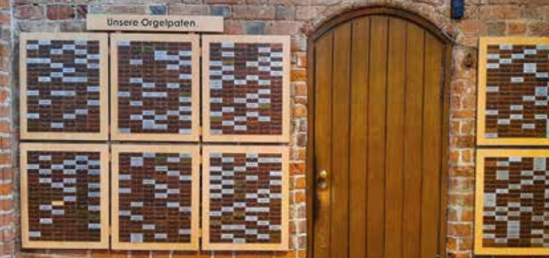
Die Orgelpatentafeln wandern auf die Empore und machen Platz für die Kirchenmusiktafeln.