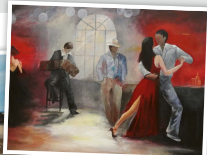
Impressionen aus den Malkursen