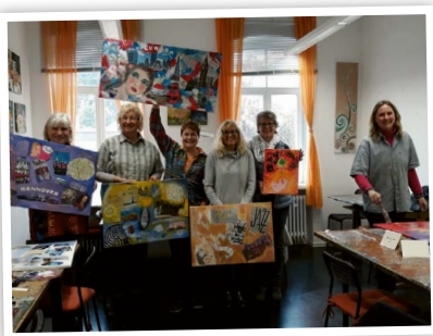
Impressionen aus dem Workshop „Transfer- und Mischtechnik“