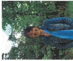
Stellv. MAV - Vorsitzende Erzieherin