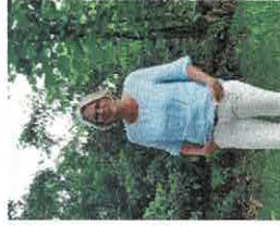
Vorsitzende der MAV Soltau