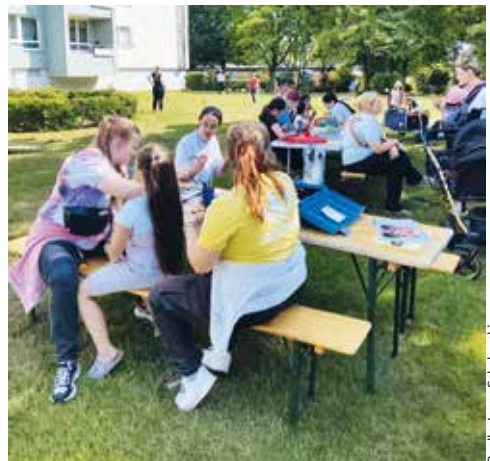
Basteln, Spielen und Schminken am Neptunhof