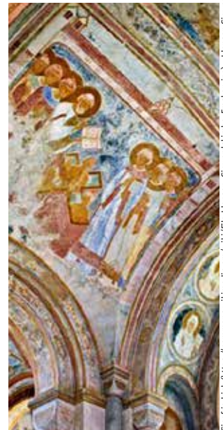
Deckenausschnitte der Sigwardskirche