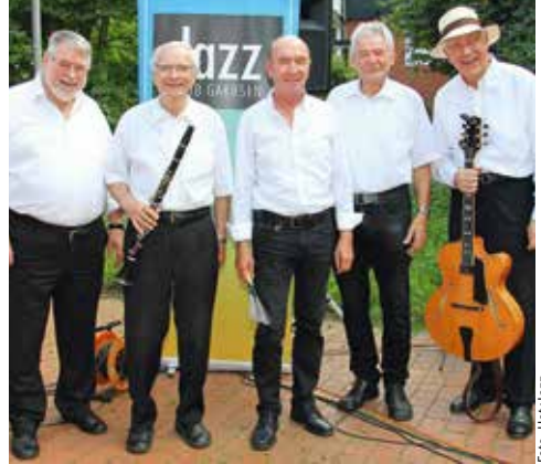
Hot4Jazz - Swingtett