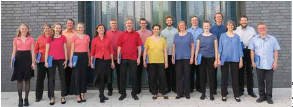
Spring's Singers vor Willehadifenster