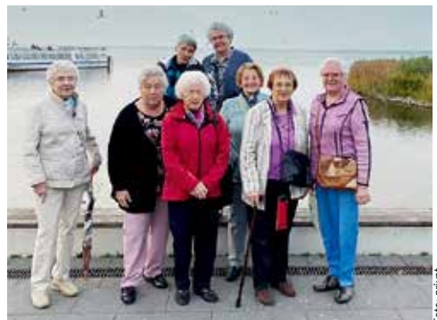
Ausflug an das Steinhuder Meer in 2023