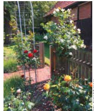
Rosengarten des Kloster