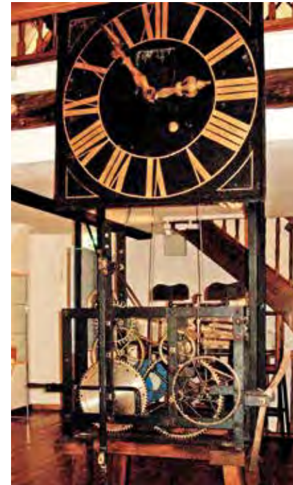
Altes Uhrwerk heute im Heimatmuseum

St. Urban, du Schützer und Schirmer der Reben, erfleh' uns den Segen im Weinberg und Leben