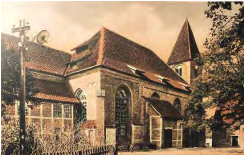
Auf dieser Postkarte von ca. 1913 sind die Anbauten aus der Findorff-Zeit noch gut zu erkennen.

1934/35 wurden bei umfassenden Erneuerungsarbeiten die als störend empfundenen Anbauten aus der Findorffzeit wieder entfernt und die Eingänge neu gestaltet.