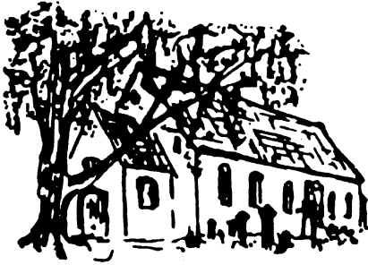
Kirche St. Maria/St. Nikolaus