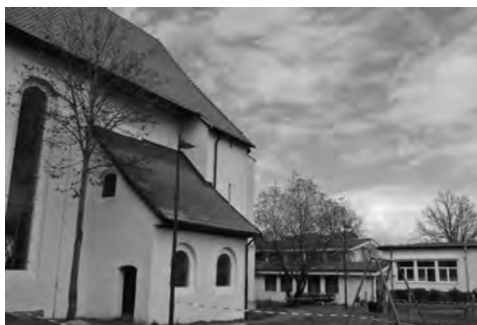
Eine gute Nachbarschaft