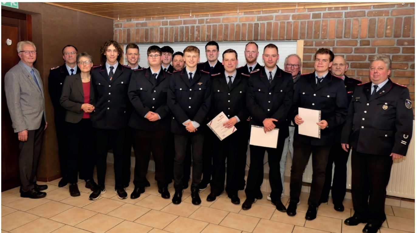
Alle Geehrten, Beförderten und Gäste der JHV 2023