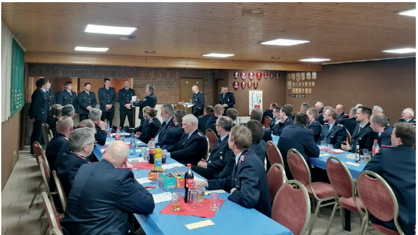
Die Vereidigung neue Feuerwehrkameraden mit dem FW-Eidspruch.