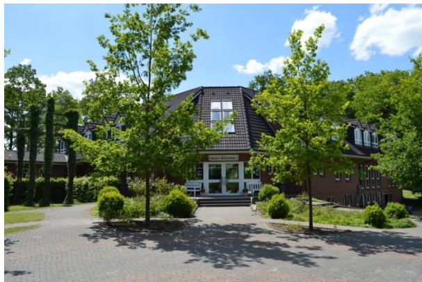
Unser Haus in Oese