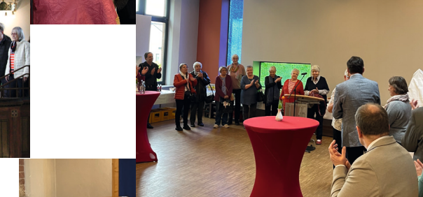
Hier ein Bild von der Amtseinführung in ihrer neuen Gemeinde St. Johannes in Tostedt am 05. Mai 2024: