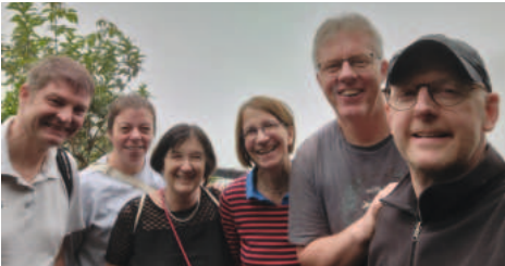
Die Delegation unseres Kirchenkreises

Seit fast 35 Jahren besteht die offizielle Partnerschaft zwischen unserem Kirchenkreis Bremervörde-Zeven und dem Igwa Kirchenkreis in der Mpumalanga-Provinz von Südafrika.