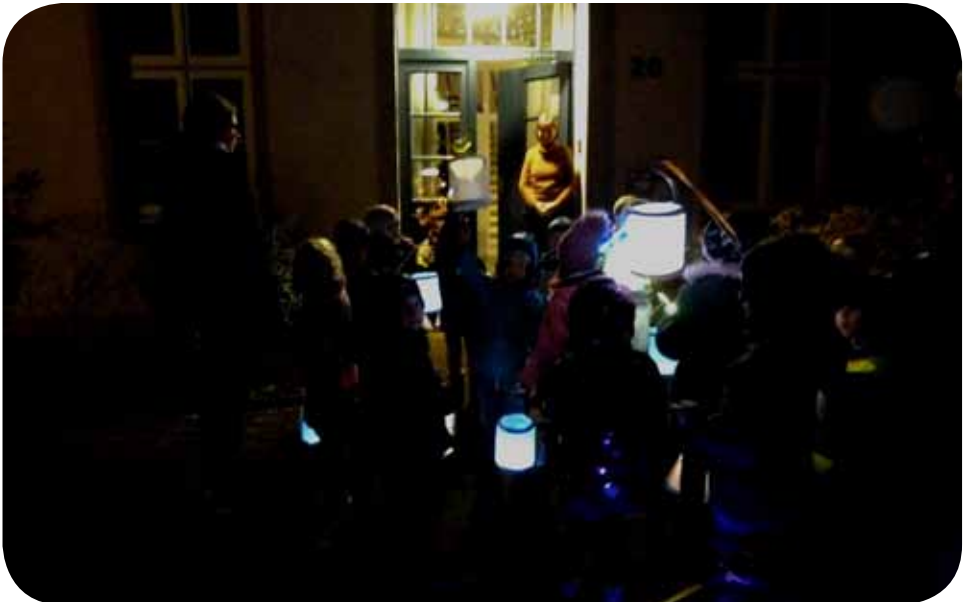
Laternenumzug der Kinder zur Pastorin

on umgehen können. Sicher, ihnen bleibt nichts Anderes übrig als sich anzupassen oder krasser ausge drückt: sich dem zu ergeben. Die Jüngsten in unseren Kitas kennen ja nur das Leben mit Corona.