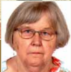
Neu im KV