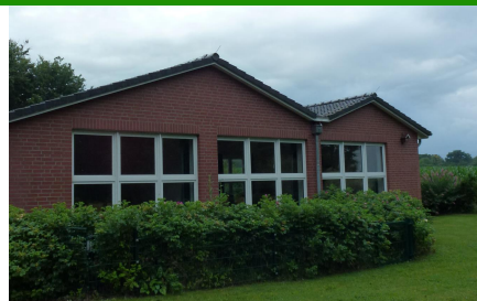
Unser schönes Gemeindehaus