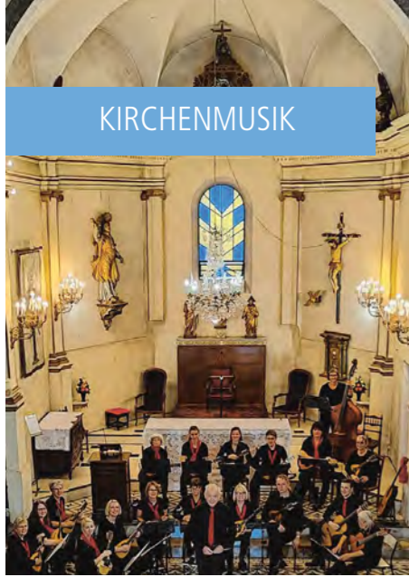
Langendorfer Mandolinenorchester in „Amélie-les-Bains“, Frankreich.