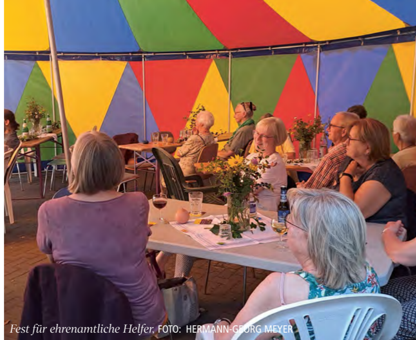
Fest für ehrenamtliche Helfer

Die Vorfreude auf Weihnachten steigt und damit kommt die alljährliche Frage auf: Was verbirgt sich hinter dem nächsten Türchen des Adventskalenders? Diese kindliche Begeisterung können auch Erwachsene erleben! Die angehenden Pastorinnen und Pastoren der Landeskirche Hannovers haben für Sie 24 kleine, besinnliche Andachten zum Hören vorbereitet. Diese adventlichen Gedanken sollen Sie auf das wichtigste Fest des Jahres einstimmen und die Wartezeit versüßen. Entdecken Sie die verborgenen Überraschungen für die Ohren auf der Webseite https://www.advent-e.de . Und erinnern Sie sich noch an unseren exklusiven Magazin-Adventskalender aus dem letzten Jahr? Auch in diesem Jahr können Sie sich wieder an jedem Tag im Advent auf die Suche nach der Zahl des Tages machen, die sich irgendwo im Heft versteckt hat und eine Liedzeile aus einem Advents- oder Weihnachtslied für Sie bereithält. Wir wünschen Ihnen viel Spaß dabei! jl