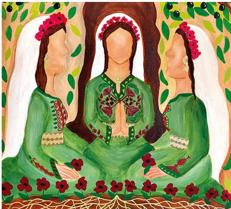
„... durch das Band des Friedens“ - Weltgebetstag 2024

Wir freuen uns auf Sie und Ihre Ideen! Thea Heusler und Hildegard Sanner