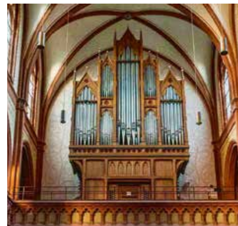
Hillebrand-Orgel in der Dreifaltigkeitskirche