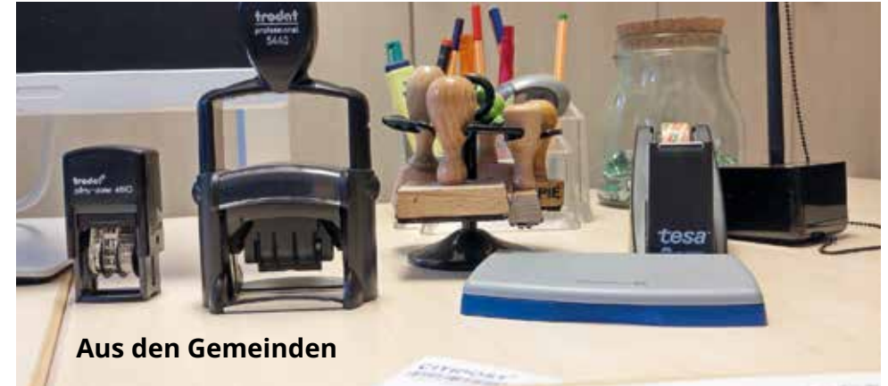
Aus den Gemeinden