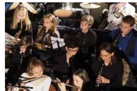
Poporchester: Do 14-tägig, Markuskirche