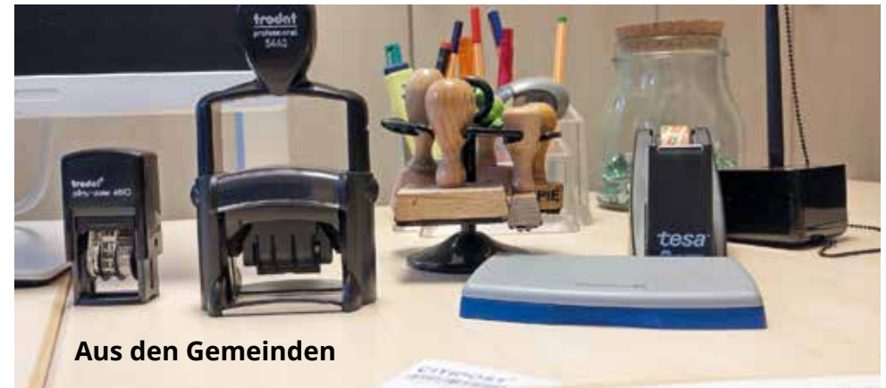
Aus den Gemeinden