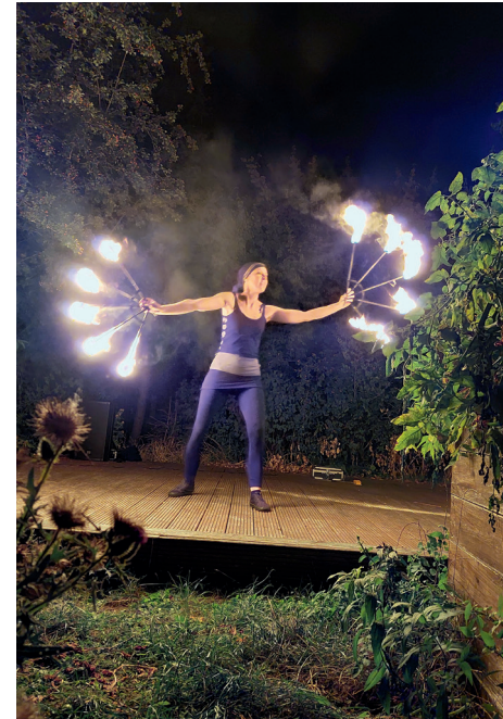
Feuerflut zum Stiftungsfest im Kirchgarten