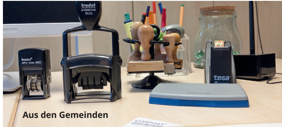
Aus den Gemeinden